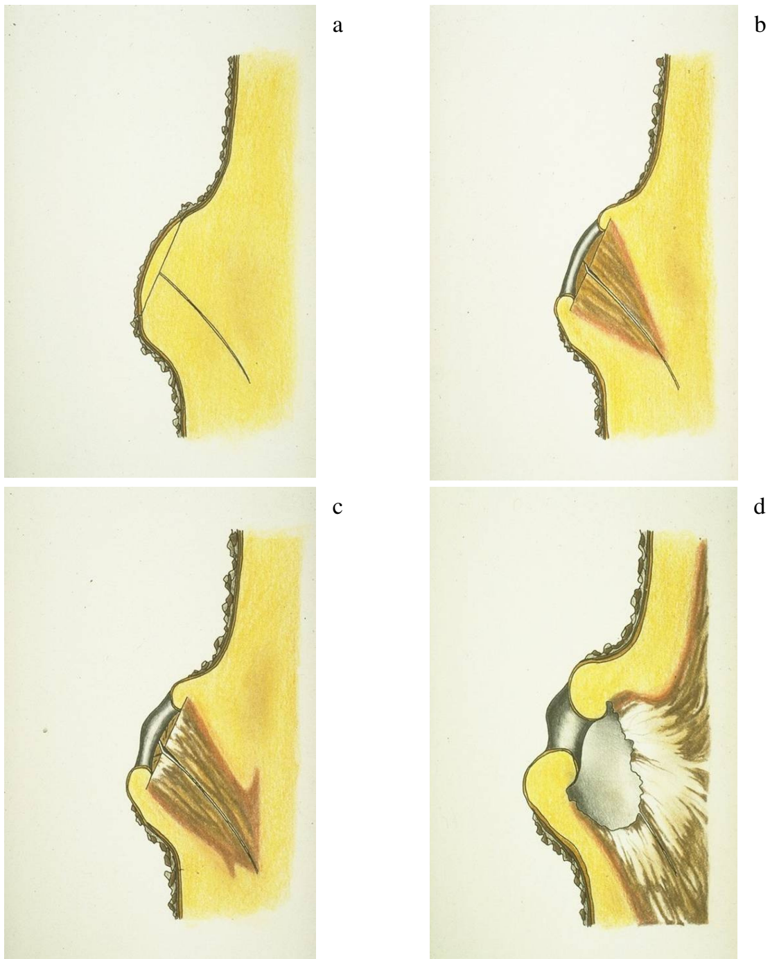
Abb. 2 a-d: Das CODIT-Prinzip am Beispiel einer effektiv abschottenden Baumart. a: Phase 1: Eindringen der Luft; b: Phase 2: Eindringen von Schaderregern, z. B. holzerstörende Pilze; c: Phase 3: Ausbreitung der Schaderreger; d: Die Wunde verbleibt in der Phase 3. Der Schaden wird nicht eingekapselt, die Schaderreger bleiben aktiv und stellen zumindest latent eine Gefahr für den Baum dar.